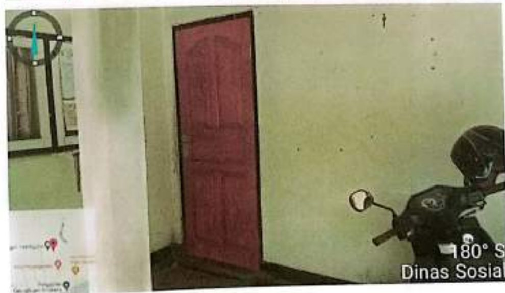
Pekerjaan Kusen dan Pintu

PEKERJAAN : PENGAWASAN PEMELIHARAAN BANGUNAN GEDUNG - BANGUNAN GEDUNG TEMPAT KERJA - BANGUNAN GEDUNG KANTOR